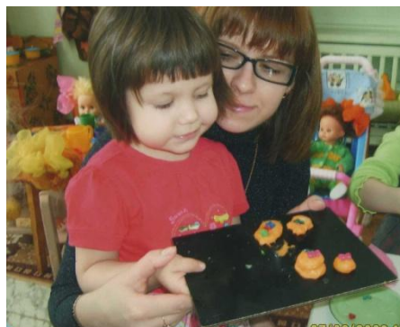
"Наше с мамой угощение"