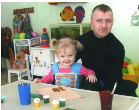
"С папой всё получится!"

Результатом проектной деятельности стала выставка детско-родительских работ "Рисуем и лепим сами".